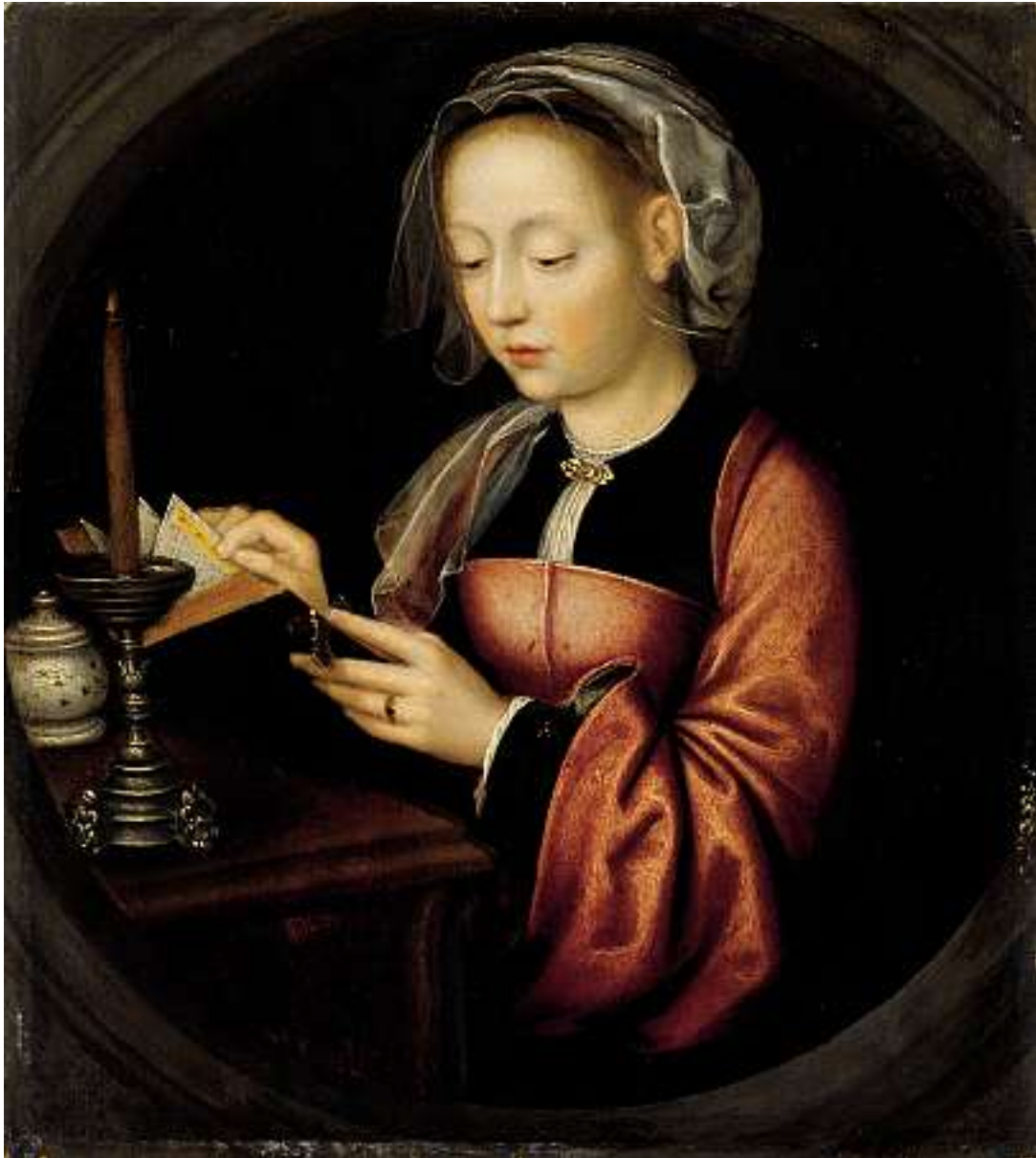
CORNELIS VAN CLEVE zugeschrieben Antwerpen 1520-1594 Antwerpen Bei Kerzenschein lesende Maria Magdalena Öl auf Holz, 22 x 20 cm (gemaltes Tondo). Verkauft im November 2004 für CHF 60'000 (EUR 38'700, USD 48'000) Auktion 391, Nr. 1015