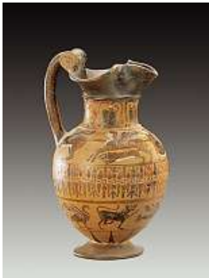
Pontische' Kleeblattkanne, Etrurien, um 525 vor Chr. Schwarzer, Rot und Weiss gehöhter Dekor. Vier Friese: Tierfries; Sirenen, Schwäne und Panther; Doppellotusfries; Hauptfries; 4 geflügelte Kentauren, rennende Frau und Hunde; Palmetten-Knospenfries. Höhe 22,4 cm.

Verkauft im November 2005 für CHF 18'500 (EUR 11'900, USD 14'800)