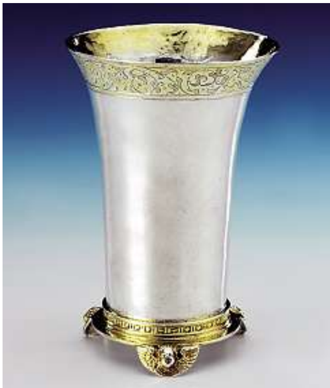
Stauf, Deutschland, Anfang 17. Jh. Silber graviert und teilweise vergoldet. Meistermarke FK. Gewicht 120 gr., Höhe 12,5 cm.

Verkauft im Juni 2003 für CHF 15'000 (EUR 9'700, USD 12'000) Auktion 385, Nr. 4226