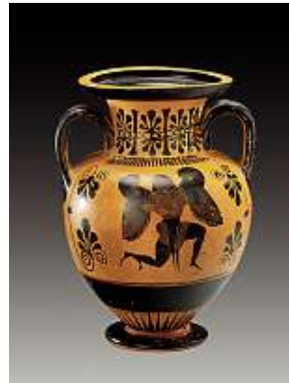
Attische Halsamphora, um 500 v. Chr. Schwarzfigurig. A: Herakles bezwingt Triton; B: laufende Gorgone; unter Henkel Palmettenmotiv. Restauriert. Höhe 22,3 cm.

Verkauft im November 2005 für CHF 16'000 (EUR 10'300, USD 12'800)