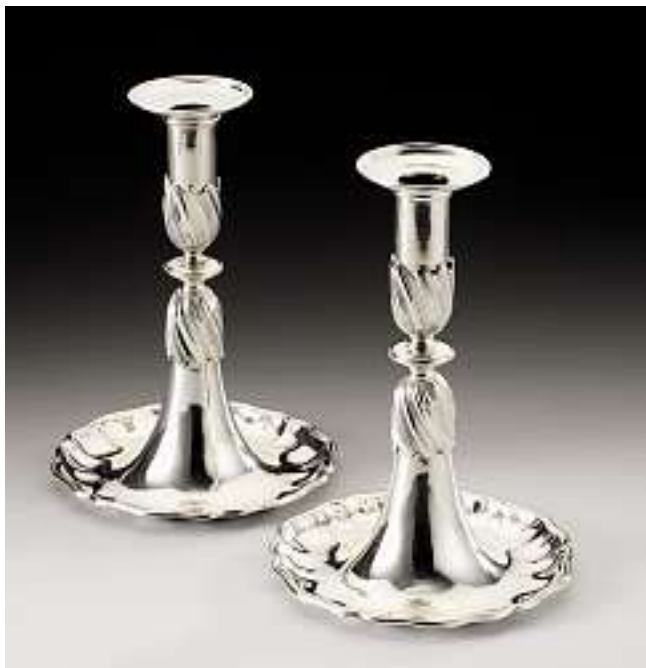
Ein Paar Trompetenleuchter, Zürich, um 1770 Silber. Sechspassfuss. Meistermarke Hans Rudolf Manz. Höhe 21 cm, Gewicht 770 gr.

Verkauft im November 2005 für CHF 20'000 (EUR 12'900, USD 16'000) Auktion 394, Nr. 4181