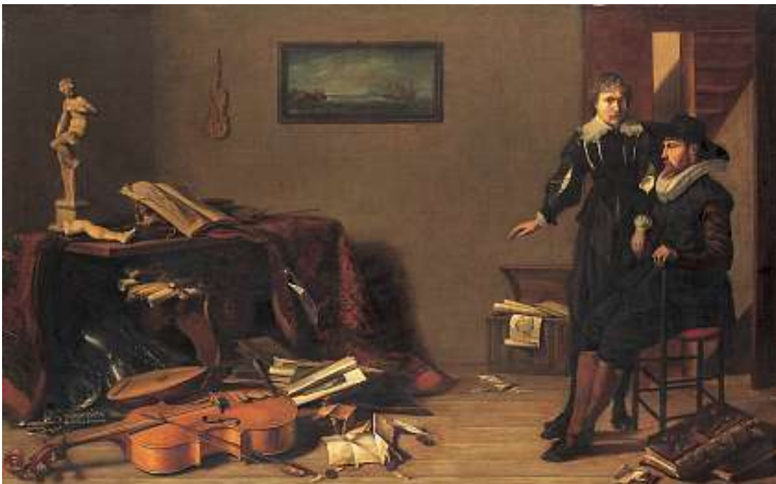
PIETER CODDE zugeschrieben Amsterdam 1599-1678 Amsterdam

Verkauft im Juni 1996 für CHF 175'000 (EUR 112'900, USD 140'000) Auktion 348, Nr. 2021