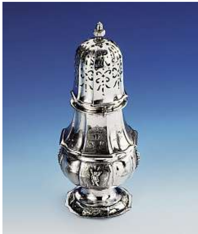
Zuckerstreuer, Zürich, 2. Viertel 18. Jh. Silber graviert und punziert. Später gravierte Initialen "AZ". Meistermarke Johann Heinrich Grob. Gewicht 260 gr., Höhe 19,5 cm.

Verkauft im Juni 2003 für CHF 23'000 (EUR 14'900, USD 18'400) Auktion 385 Nr. 4201