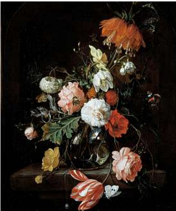
CORNELIS DE HEEM Leiden 1631-1695 Antwerpen

Verkauft im Juni 1997 für CHF 85'000 (EUR 54'800, USD 68'000) Auktion 356, Nr. 2039