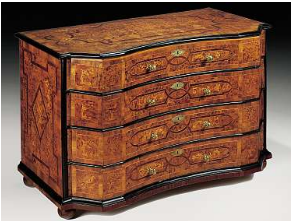
Kommode, Luzern, um 1730 Verschiedene Hölzer figürlich und floral parkettiert, graviert und brandschattiert. Gerader, frontal doppelt eckig geschweifeter, 4-schublädiger Korpus auf Ballenfüssen. Frontal und seitlich Bandwerkrahmen mit Blumen- und Vogelmotiven. Die Platte mit Bandwerkrahmen mit Rosettengitter und figürlichem Springbrunnen umgeben von Zierbäumchen und Figuren. 82,5 x 129 x 64 cm. Verkauft im November 2002 für CHF 27'000 (EUR 17'400, USD 21'600) Auktion 382, Nr. 3076