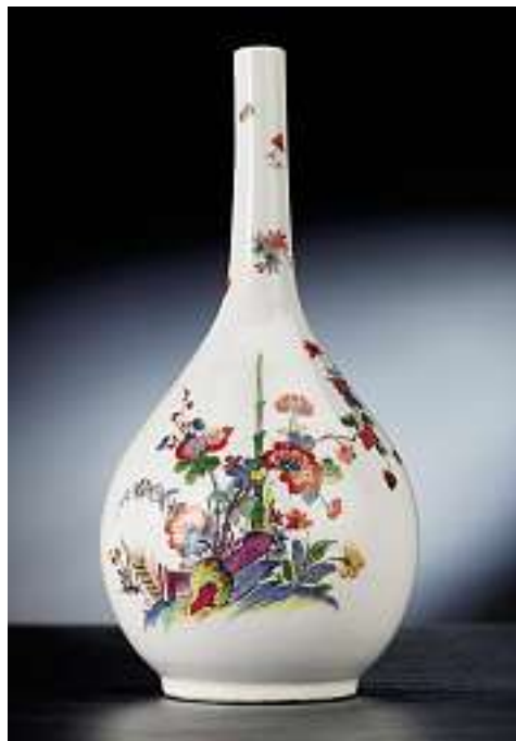
Enghalsvase, Meissen, um 1730 Porzellan. Polychromer Kakiemon-Dekor. Am Boden "Johanneumsnummer" "N: 338 w". Höhe 22 cm.

Verkauft im November 2002 für CHF 15'000 (EUR 9'700, USD 12'000)