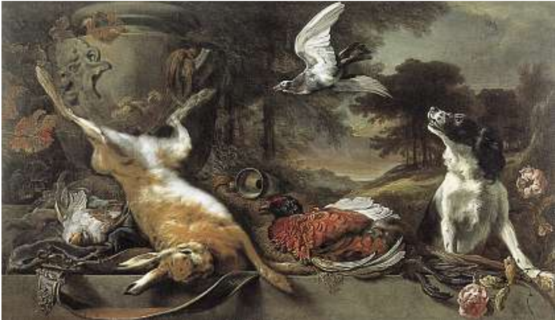
JAN WEENIX Amsterdam um 1640-1719 Amsterdam

Jagdstillleben Unten links signiert und undeutlich datiert 1691/97 (?). Öl auf Lwd., 92 x 154 cm.