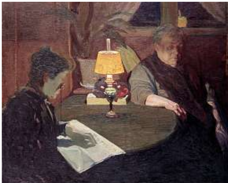
GINO SEVERINI Cortona 1883-1966 Paris