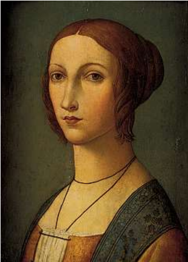
Schule des SANDRO BOTTICELLI. Florenz um 1510-20

Bildnis einer jungen Frau Tempera auf Holz, 41,5 x 28,8 cm.