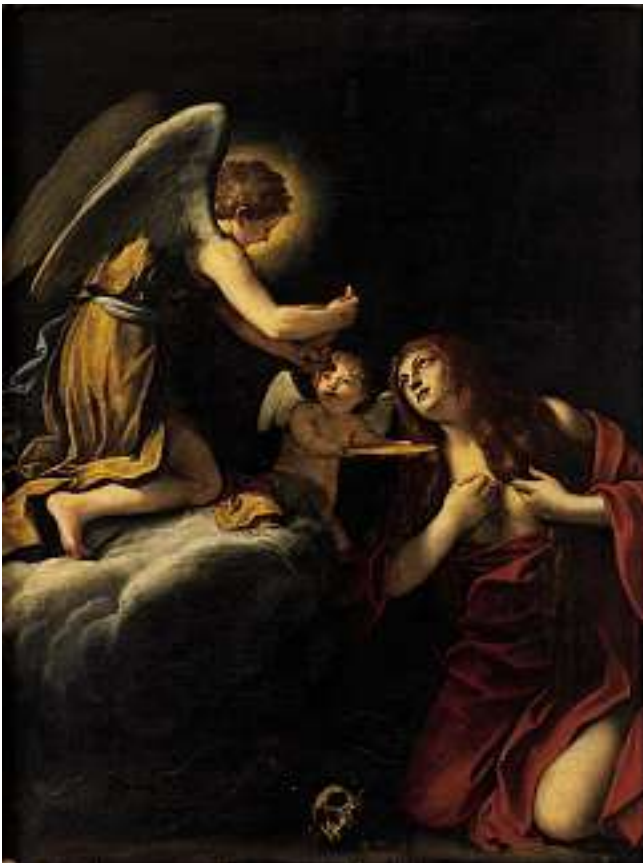
DOMENICHINO eigentlich DOMENICO ZAMPIERI zugeschrieben