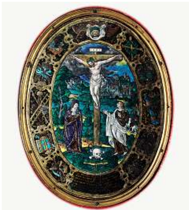
JEAN DE COURT Tätig in der 2. Hälfte 16. Jh.

Kreuzigung In der Mitte unten monogrammiert. Rollwerkrahmung mit den Leidenswerkzeugen Christi und Inschrift. Emailmalerei, 30 x 21,5 cm (oval).