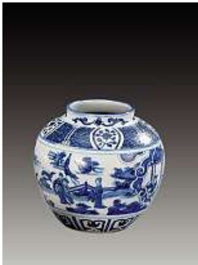
Bauchiger Topf, China Porzellan. Blauer Figurenfries im Freien. Aus der Schulter Blumenmedaillons auf Schuppenfond. Am Boden 4 Zeichenmarke. Höhe 16,5 cm.

Verkauft im November 2005 für CHF 9'500 (EUR 6'100, USD 7'600)