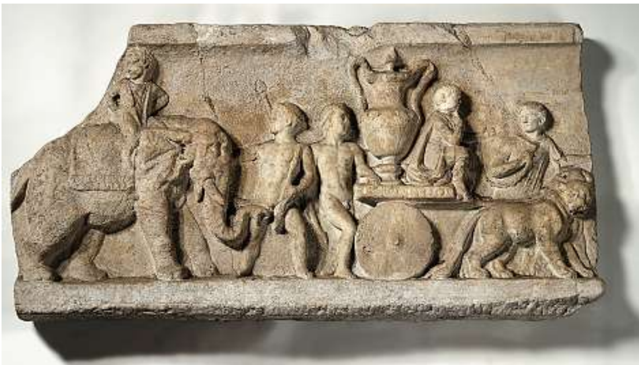
2 Fragmente eines dionysischen Sarkophages, römisch und später

Steinreliefs. Ca. 55 x 110 cm, bzw. ca. 42 x 33 cm. Wohl Rückseite eines Wannensarkophages.