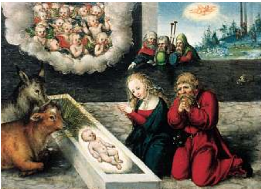
LUCAS CRANACH DER ÄLTERE Kronbach (Bayern) 1471-1553 Weimar