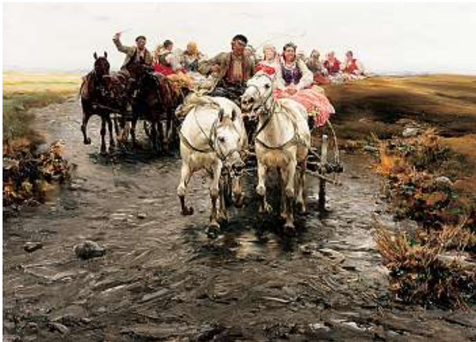
ALFRED VON WIERUSZ-KOWALSKI Swalki 1849-1915 München