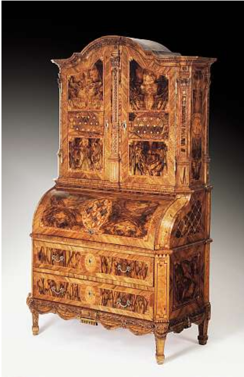
Kastenaufsatzschreibkommode, Deutschland, Louis XVI. Verschiedene Hölzer mit Gitterwerkmotiven parkettiert und Nussbaum reliefiert. 226 x 128 x 66 cm.

Verkauft im Juni 2004 für CHF 38'000 (EUR 24'500, USD 30'400)