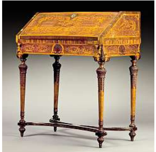
Pult, Mainz, Régence Verschiedene Hölzer floral und mit Bandwerk parkettiert. Arbeit aus der Werkstatt Heinrich Ludwig Rohde. 95 x 84 x 44 cm. Verkauft im Juni 2004 für CHF 32'000 (EUR 20'600, USD 25'500) Auktion 389, Nr. 3153