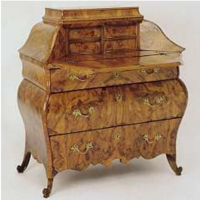
Barock-Schreibkommode Nussbaumfurnier. Italien (Lombardei), 18. Jh., 119,5 x 114 x 61 cm. Verkauft im Mai 1994 für CHF 65'000 (EUR 41'900, USD 52'000) Auktion 338, Nr. 2017