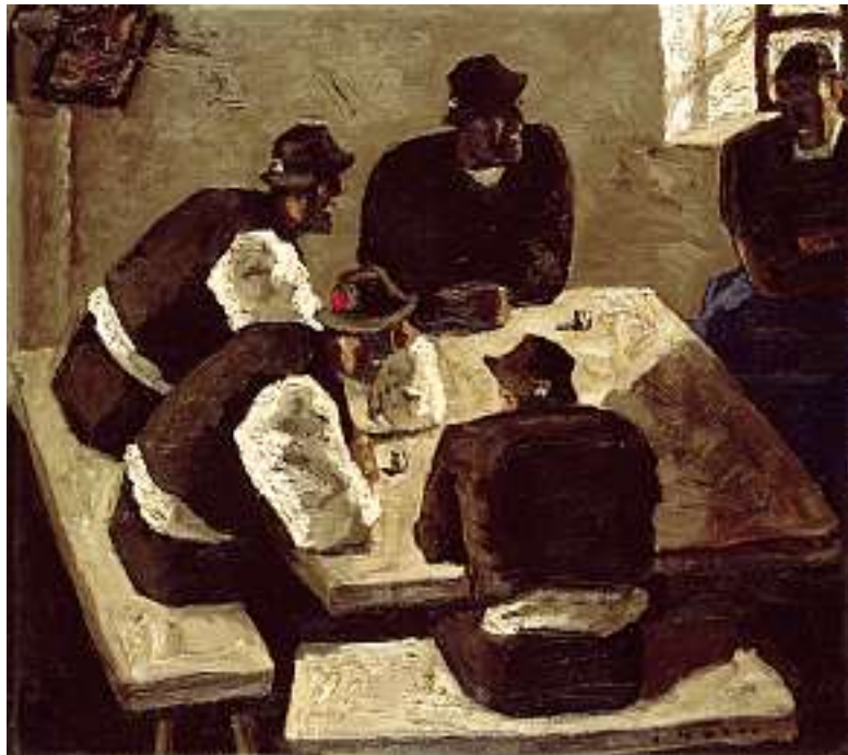
ALFONS WALDE Oberndorf 1891-1958