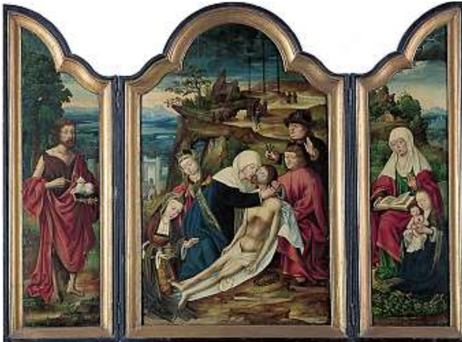
SCHULE VON ANTWERPEN 1524 Umkreis des Quentin Massys d.Ä. (1465/66-1530)