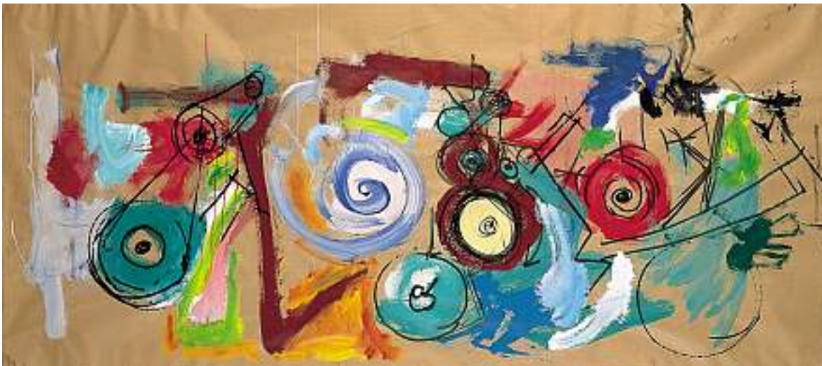
JEAN TINGUELY Fribourg 1925-1991 Bern

Verkauft im November 1996 für CHF 80'000 (EUR 51'600, USD 64'000) Auktion 352, Nr. 2152